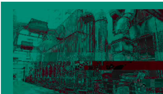
木工車間粉塵處理裝置1

在木工車間，本集團於中國所有製造基地使用了新型除塵設備，以有效降低粉塵的濃度，減少廢氣的排放，保護了從業人員的健康。同時，板式傢具廠廢水經過處理後可以在生產線上循環使用以節約水資源。通過建立密閉式噴塗裝置，使有害氣體不會外漏以保障員工安全的工作環境。(請參閱下圖)