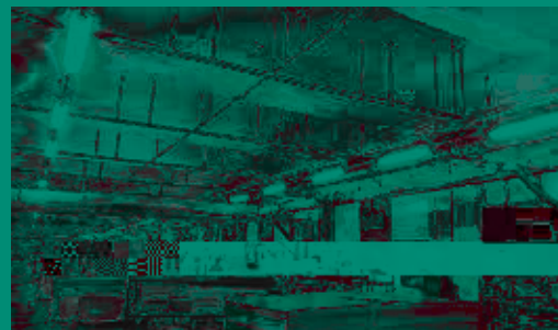
木工車間粉塵處理裝置2